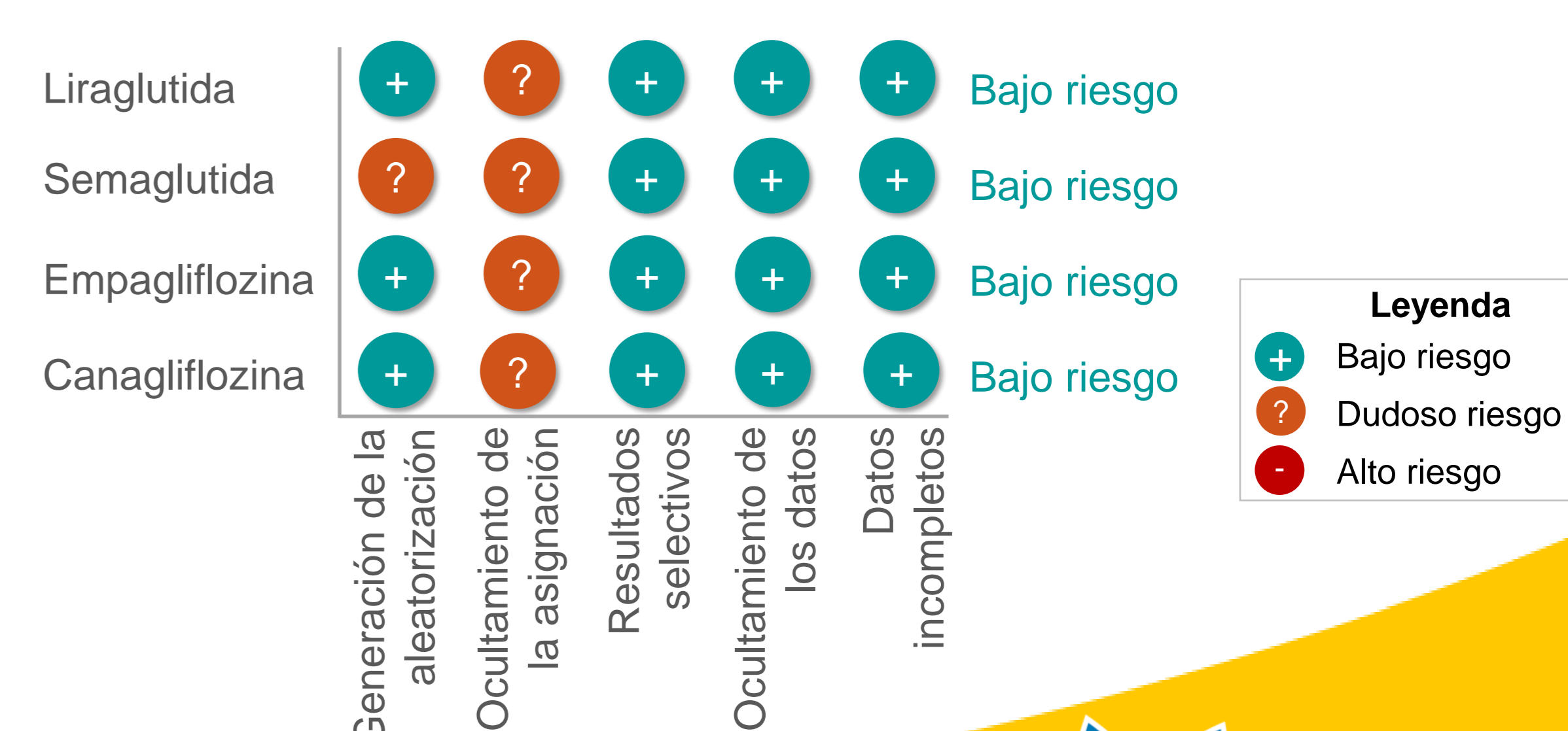
Figura 3. Resultados de la evaluación de riesgo de sesgo